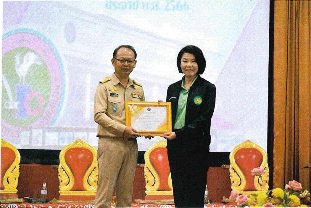
ประเภทข้าราชการองค์การบริหารส่วนจังหวัด สายงานผู้ปฏิบัติ ประเภทวิชาการ