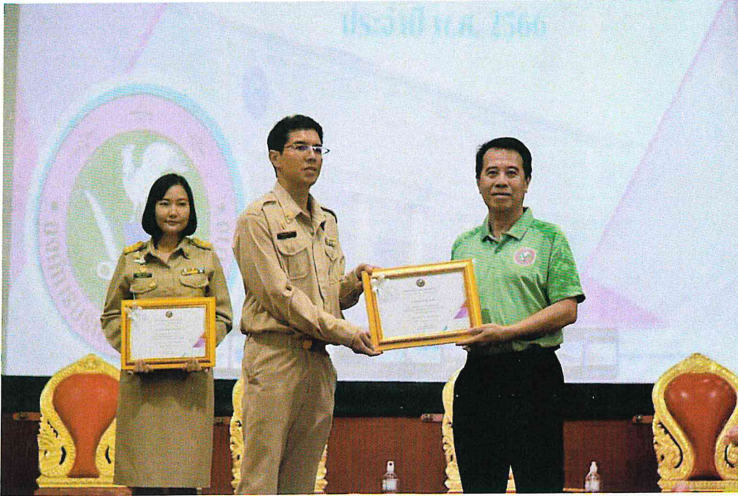
ประเภทพนักงานจ้าง หญิง