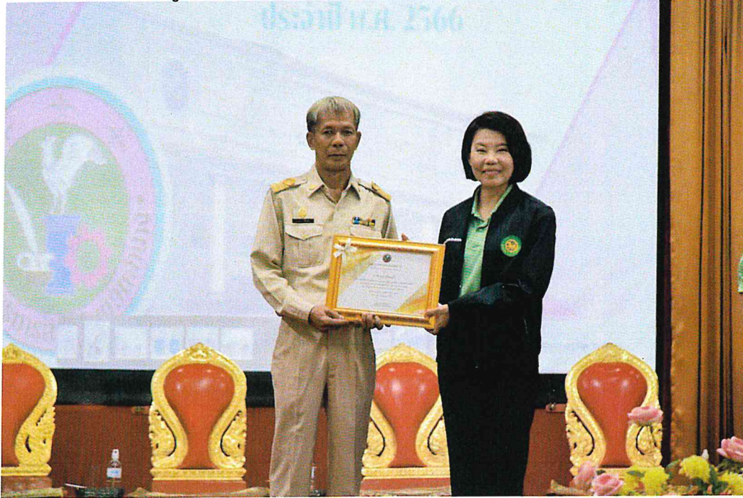
ประเภทพนักงานจ้างตามภารกิจ (ผู้มีคุณวุฒิ)